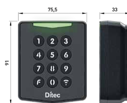
AXK4 - AXK4P