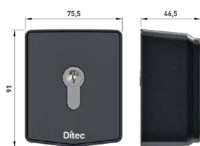
AXK5M - AXK5NM (version sans cylindre)