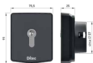
AXK51 - AXK5NI (version sans cylindre)